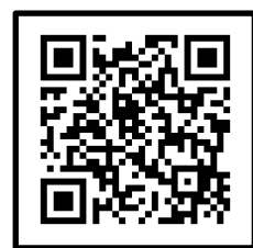
参加登録フォーム QRコード